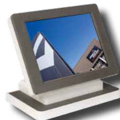
Jeden wyświetlacz cyfrowy + jeden wyświetlacz dla klienta (graficzny)