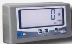
Jeden wyświetlacz cyfrowy + jeden wyświetlacz dla klienta (cyfrowy)