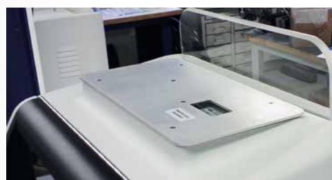
Integracja z bezpłatnym automatem frankującym