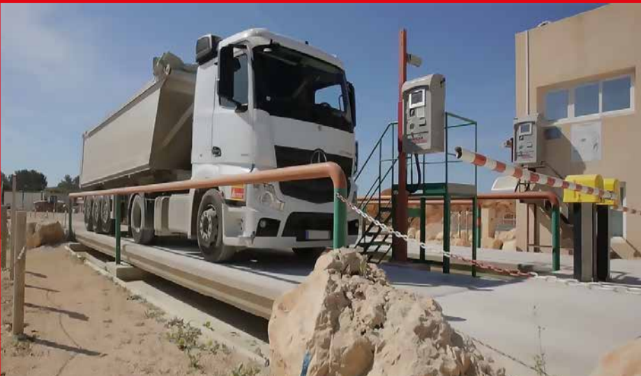
WAGI SAMOCHODOWE WJAZDOWE I WYJAZDOWE